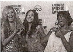
Główne bohaterki. Od lewej: Ashley Tisdale, Vanessa Hudgens, Monique Coleman.

Jak powiedział reżyser filmu Kenny Ortega magazynowi People , nie zabraknie także nowych twarzy. „Wszyscy słownie potwierdzili swój udział i mamy wielką nadzieję nakręcić ten film. W East High pojawi się także kilka nowych postaci. Będzie zabawnie, zamieszcimy trochę sytuacji” - zdradził Kenny.