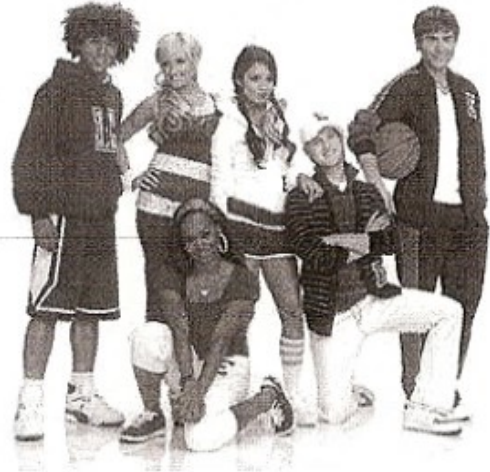
Cały zespół w komplecie. ;)